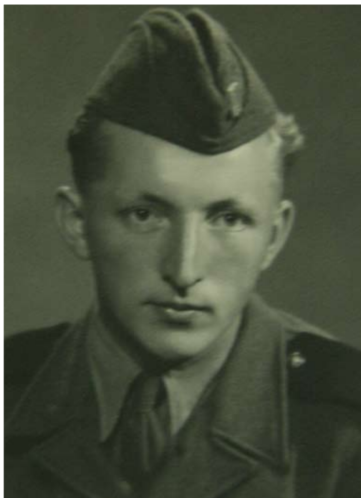
V uniformě PTP